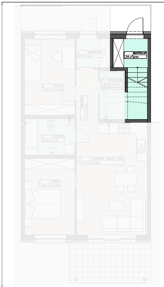
PARTER POWIERZCHNIA UŻYTKOWA: 3,94 m 2